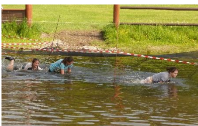
Kladruby Race – brod přes Kůrkáč